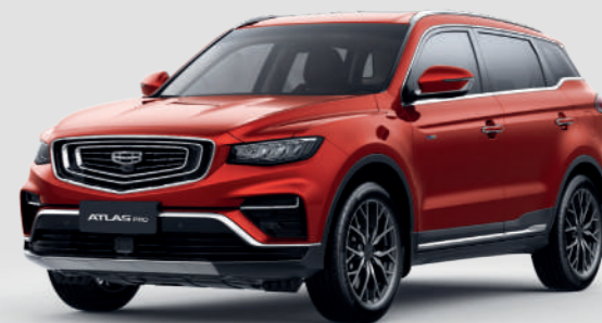
Flame Red Красный металлик