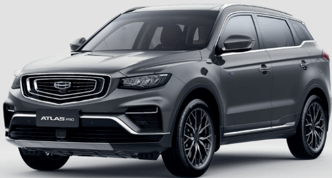
Titanium Grey Серый металлик