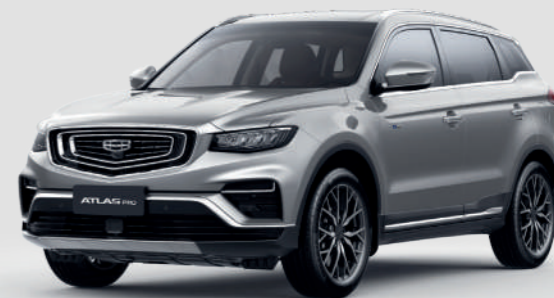
Pearl Silver Серебристый металлик