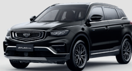
Ink Black Черный металлик