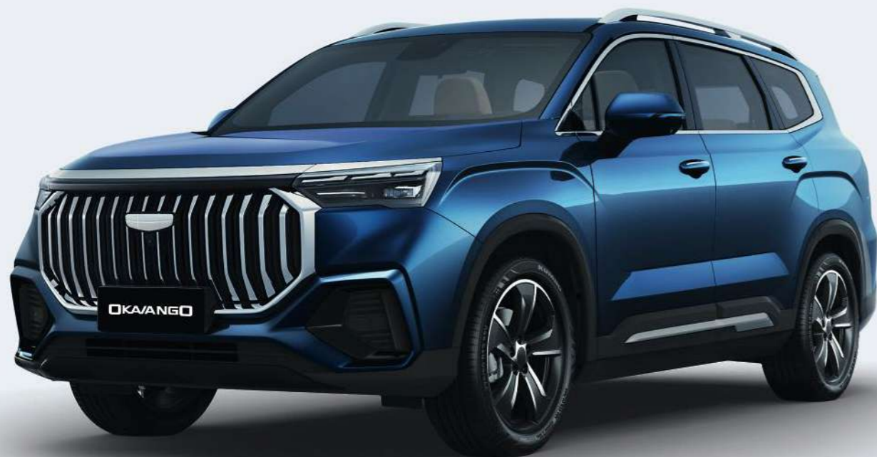
Indigo Blue Синий металлик