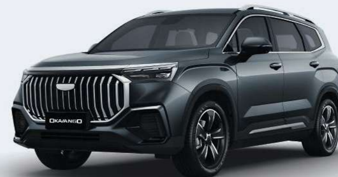
Basalt Grey Серый металлик