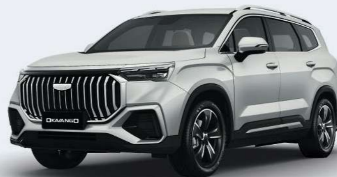
Crystal White Белый