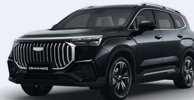
Ink Black Черный металлик